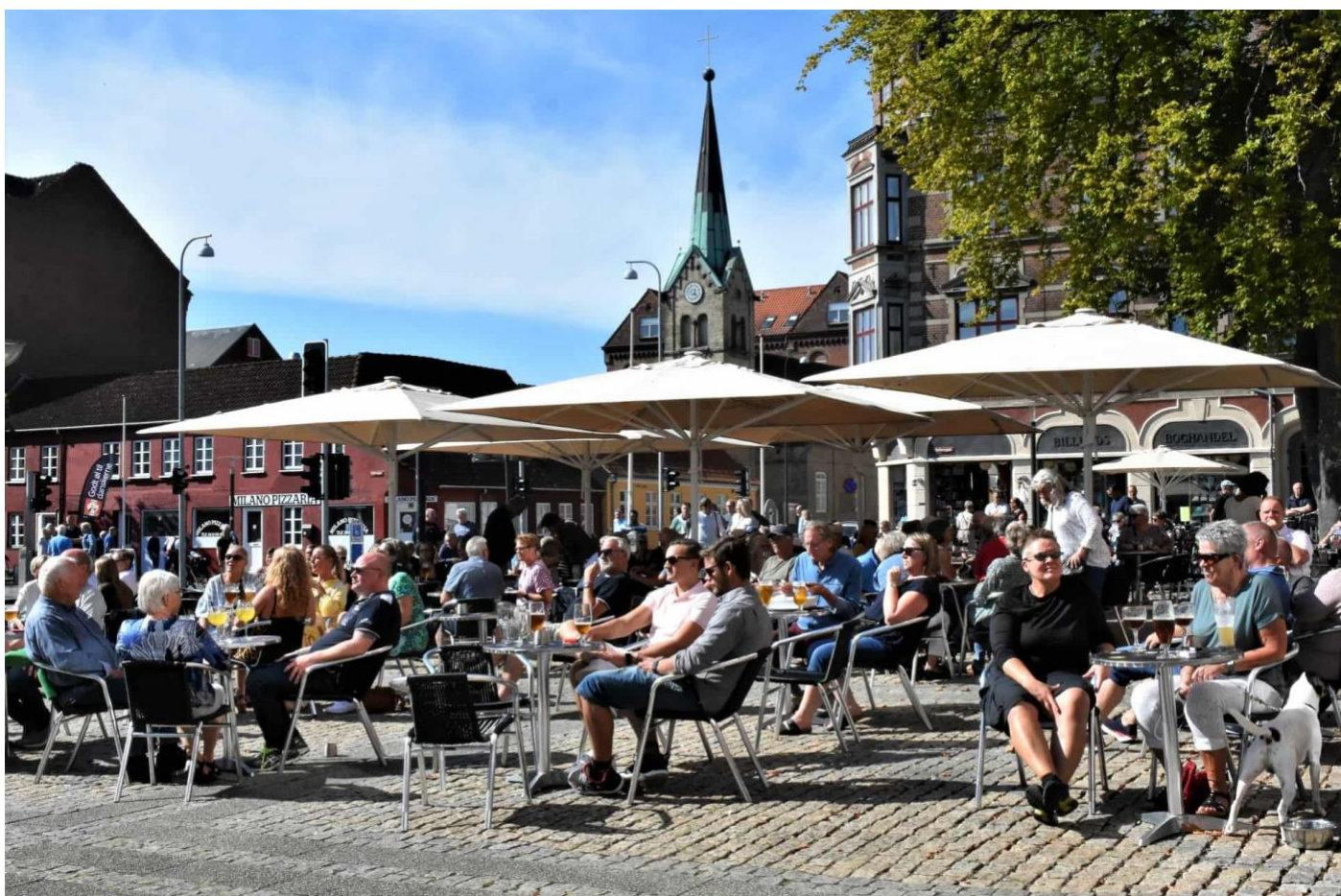
Øllets Dag