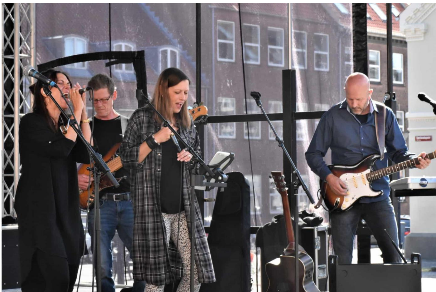
Det lokale band Barock stod for underholdningen på Ryes Plads, hvor der i dagens anledning var sat en stor scene op.