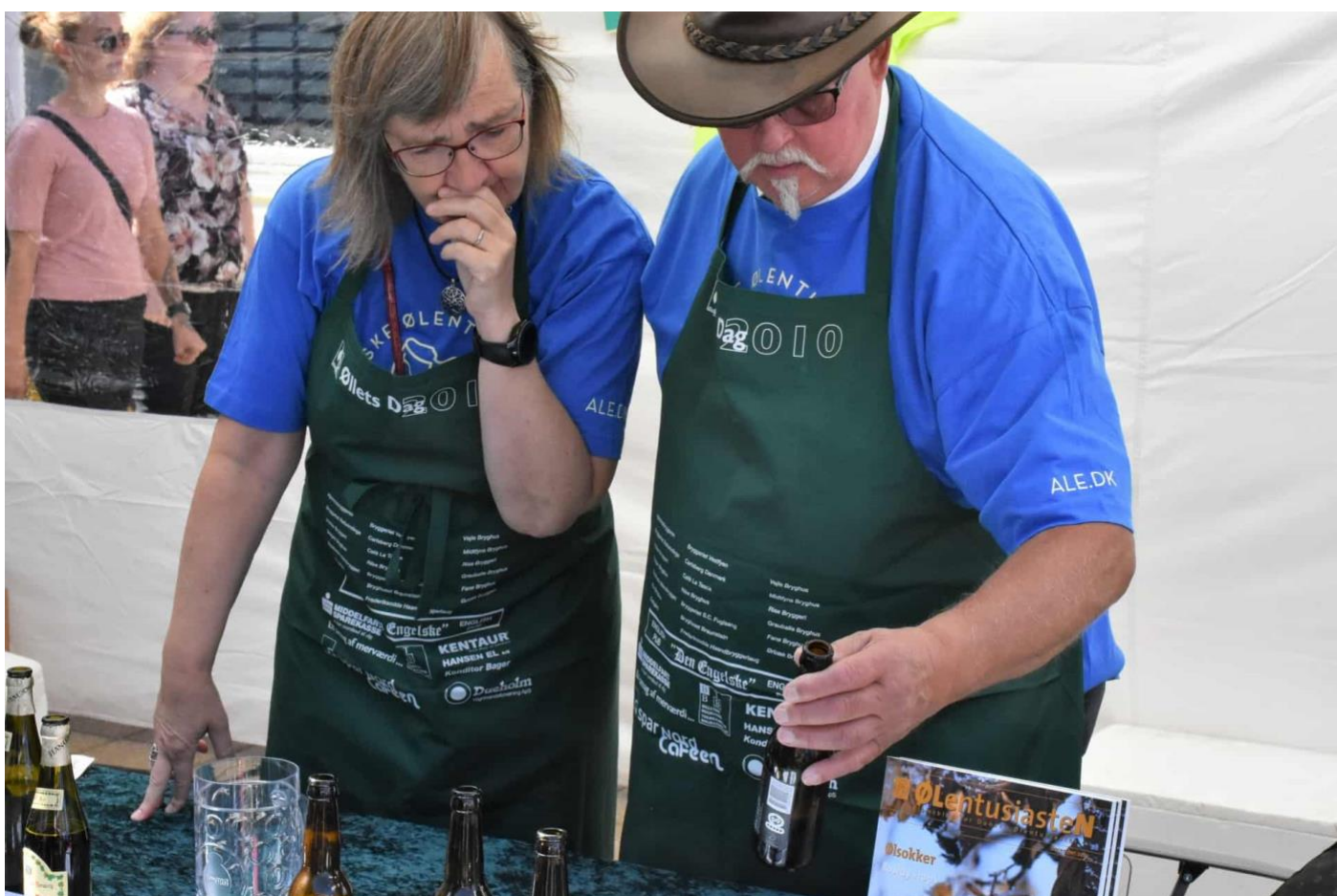
Ølentusiaster fik rig mulighed for at nærstudere de mange forskellige øl.