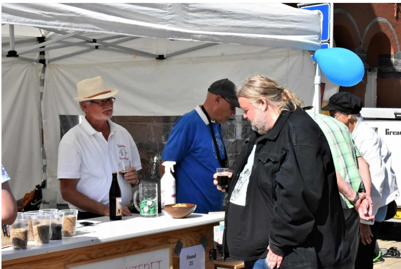
Øllets Dag