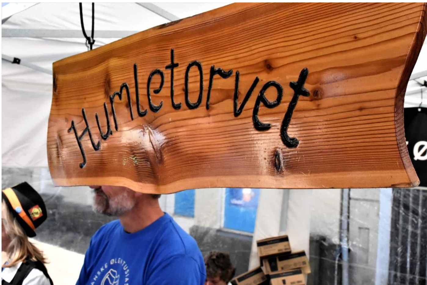
Var det noget med et smut forbi "Humletorvet"?