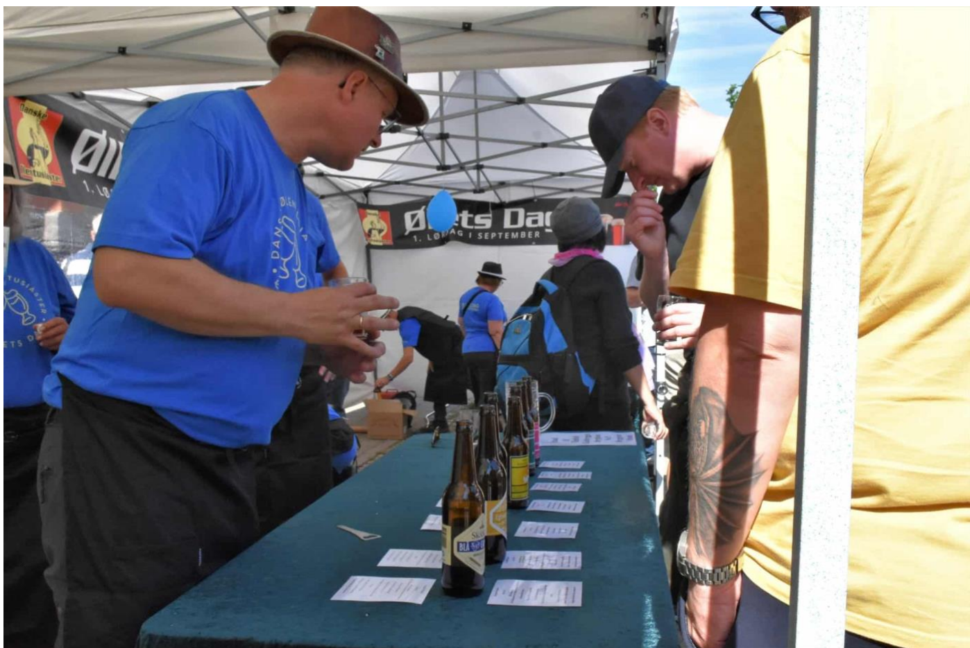
Øllets Dag